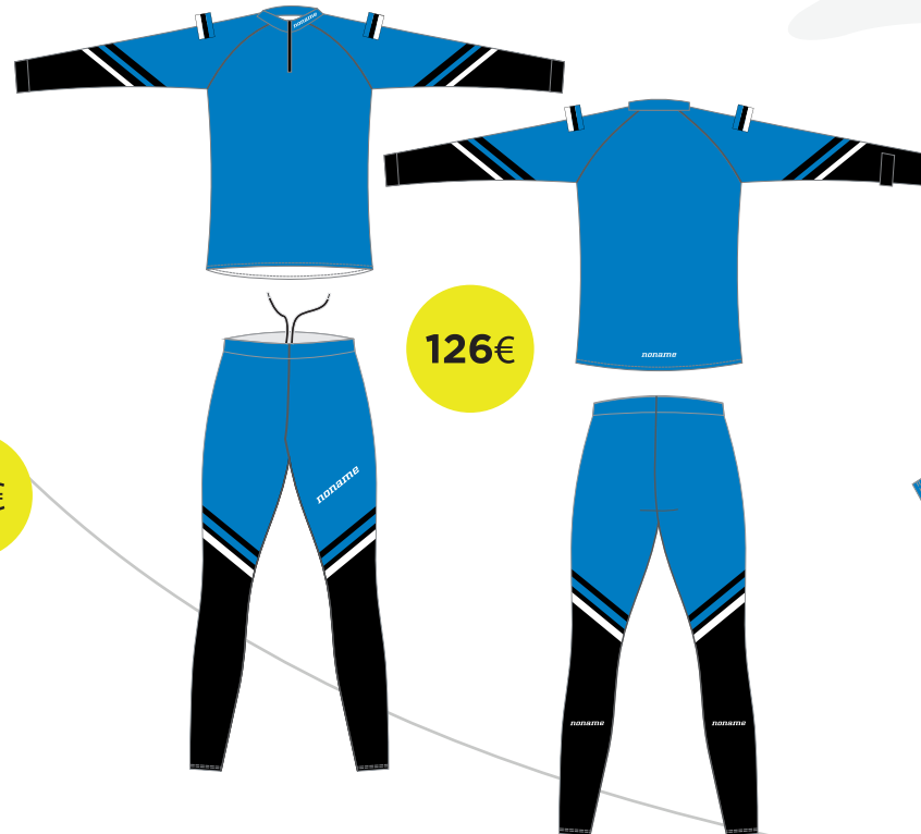
XC RACING SUUSAKOMBE NAISTE / MEESTE LÕIKED