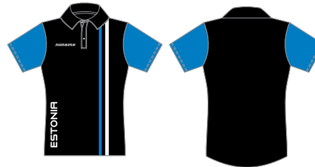
POLO SÄRK NAISTE / MEESTE LÕIKED

Funktsionaalne kraega särk esindusüritusteks ja vabal ajal kandmiseks. Valmistatud tehnilisest TRAIL TECH kangast. Väga mugava lõikega ja hästi hingav. Saadaval nii naiste kui meeste lõigetes.