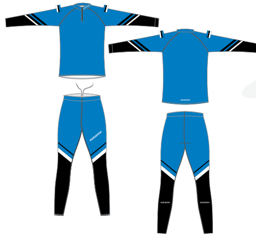
XC RACING SUUSAKOMBE NAISTE / MEESTE LÕIKED

Professionaalne võistluskombe on tehtud kõrge kvaliteediga kergest prantsuse Punto kangast, mis annab kombele nn. teise naha tunde. Ideaalne kõrge intensiivsusega treeningutel ja võistlustel. XC Racing kombe on kaheosaline. Särgil on allosas silikoonääris, seega saab seda kasutada ka pükste peal. Võistluskombe on saadaval nii naiste kui meeste lõigetes. Suurused 130, 150, XXS-XXL.