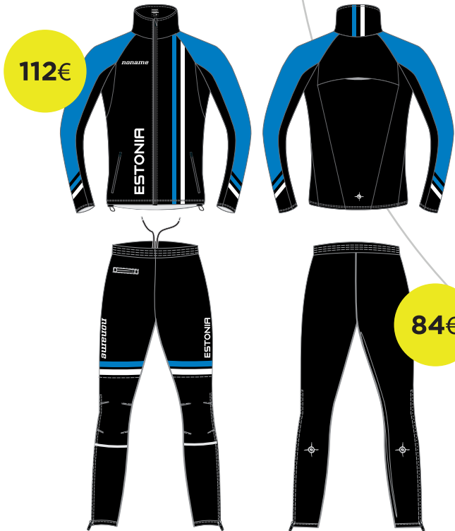
ELITE JAKK + PÜKSID NAISTE / MEESTE LÕIKED