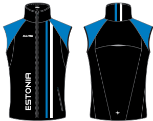
ELITE VEST NAISTE / MEESTE LÕIKED

Elite vest oli algselt välja töötatud Elite suusadressi üheks osaks, kuid tänu oma kergele kangale ja kitsale lõikele on see muutunud populaarseks ka jooksjate ja orienteerujate hulgas. Kasutatud on õhukest softshell kangast ees (30 000/10 000) ja elastsete hingavat kangast taga. Kaks teibitud taskut ees ja helkurdetailid tagaküljel tagavad ohutu liiklemise ka hämaras. Naiste ja meeste lõiked.