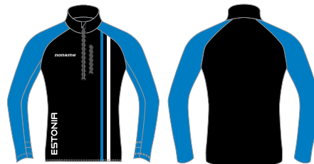
BREEZE SÄRK NAISTE / MEESTE LÕIKED

Kergest materjalist ja kitsa lõikega pusa. Võib kasutada eraldi kui vabaaja rõivast kui ka keskmise kihina sportimise ajal. Elastne ja tehniline kangas, mis on seestpoolt pehme. Breeze särgil on esiküljel lühike lukk paremaks selgasaamiseks ja lukuga tasku. Saadaval naiste ja meeste lõigetes.